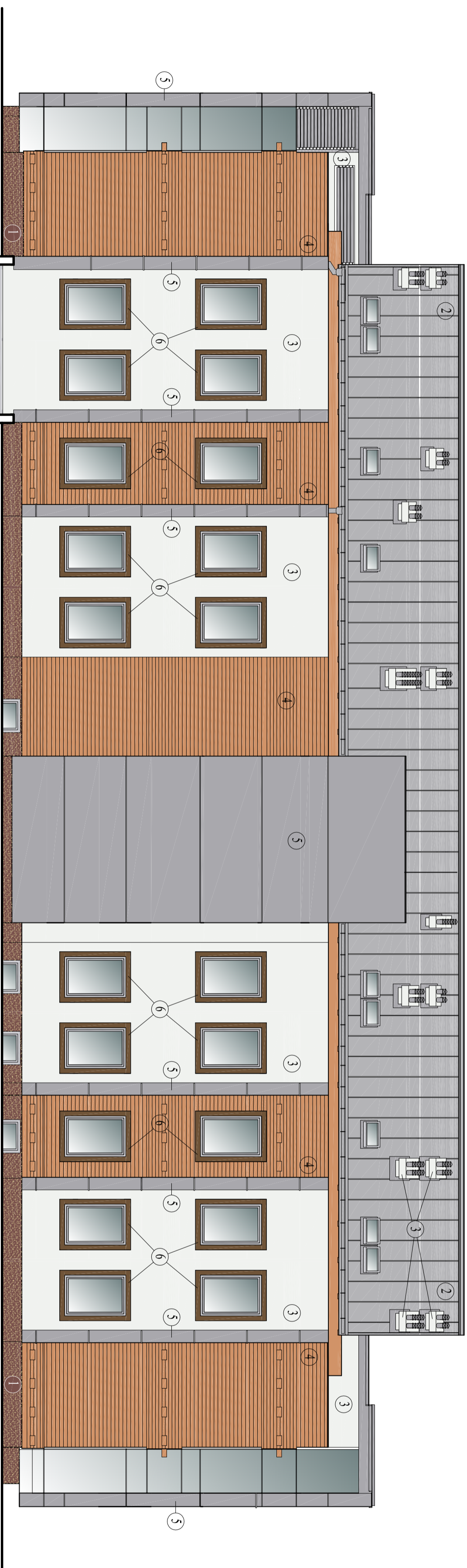
ELEWACJA PÓŁNOCNO-ZACHODNIA - kolorystyka