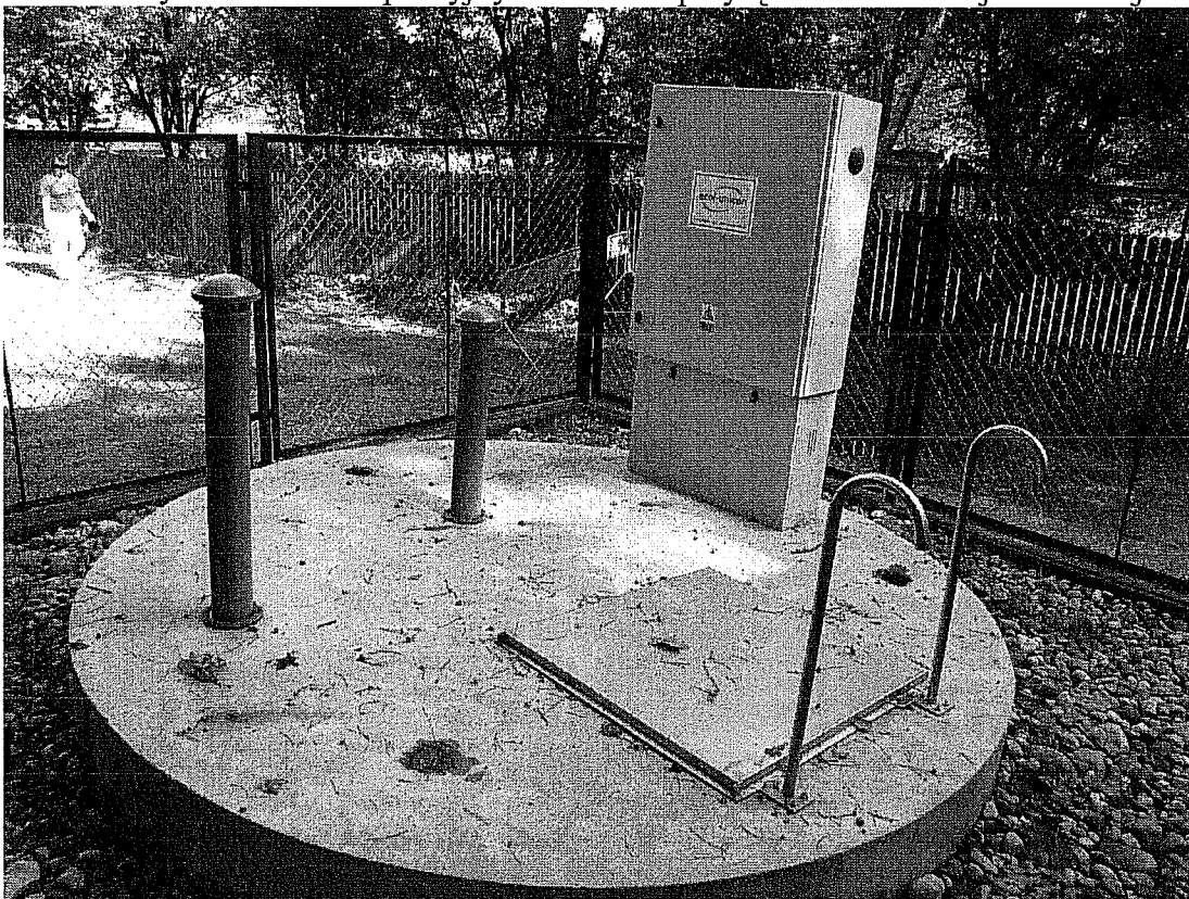
5. Tłocznia P2