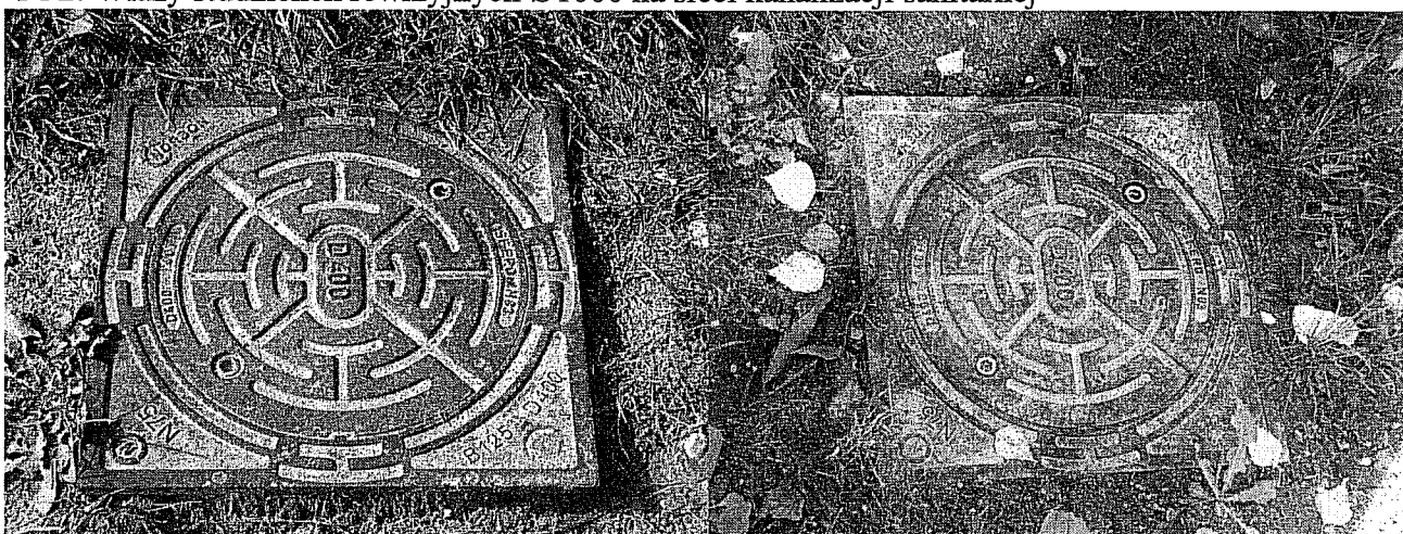
3 i 4. Włazy studzienek inspekcyjnych Ø425 na przyłączach kanalizacji sanitarnej