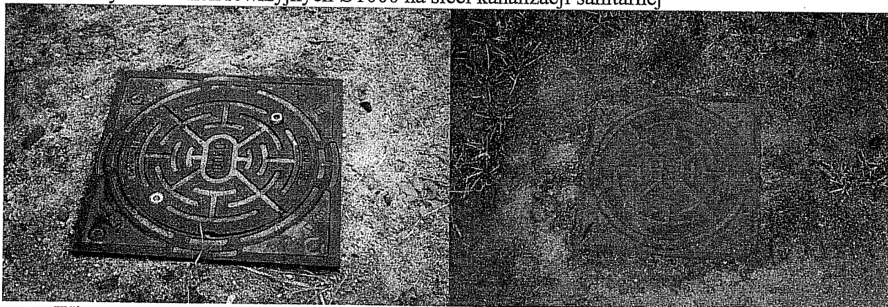
3 i 4. Włazy studzienek inspekcyjnych Ø425 na przyłączach kanalizacji sanitarnej