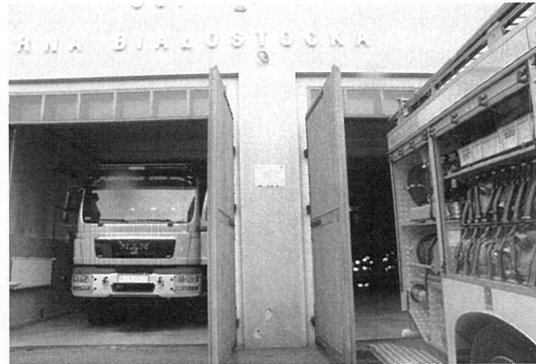
Tablica pamiątkowa umieszczona na budynku OSP w Czarnej Białostockiej

Beneficjent zamieścił informację o współfinansowaniu Projektu przez Unię Europejską na stronie internetowej Urzędu Miejskiego w Czarnej Białostockiej ( www.czarnabialostocka.pl ). Aktualny wydruk z ww. strony internetowej stanowi załącznik nr 9 do Informacji Pokontrolnej.