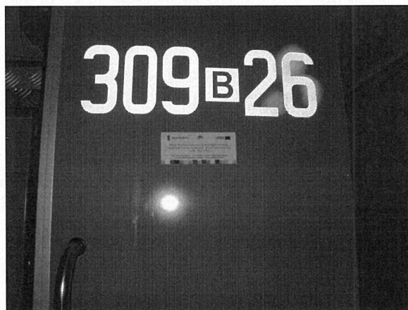
Tabliczki informacyjne umieszczone na wozach strażackich