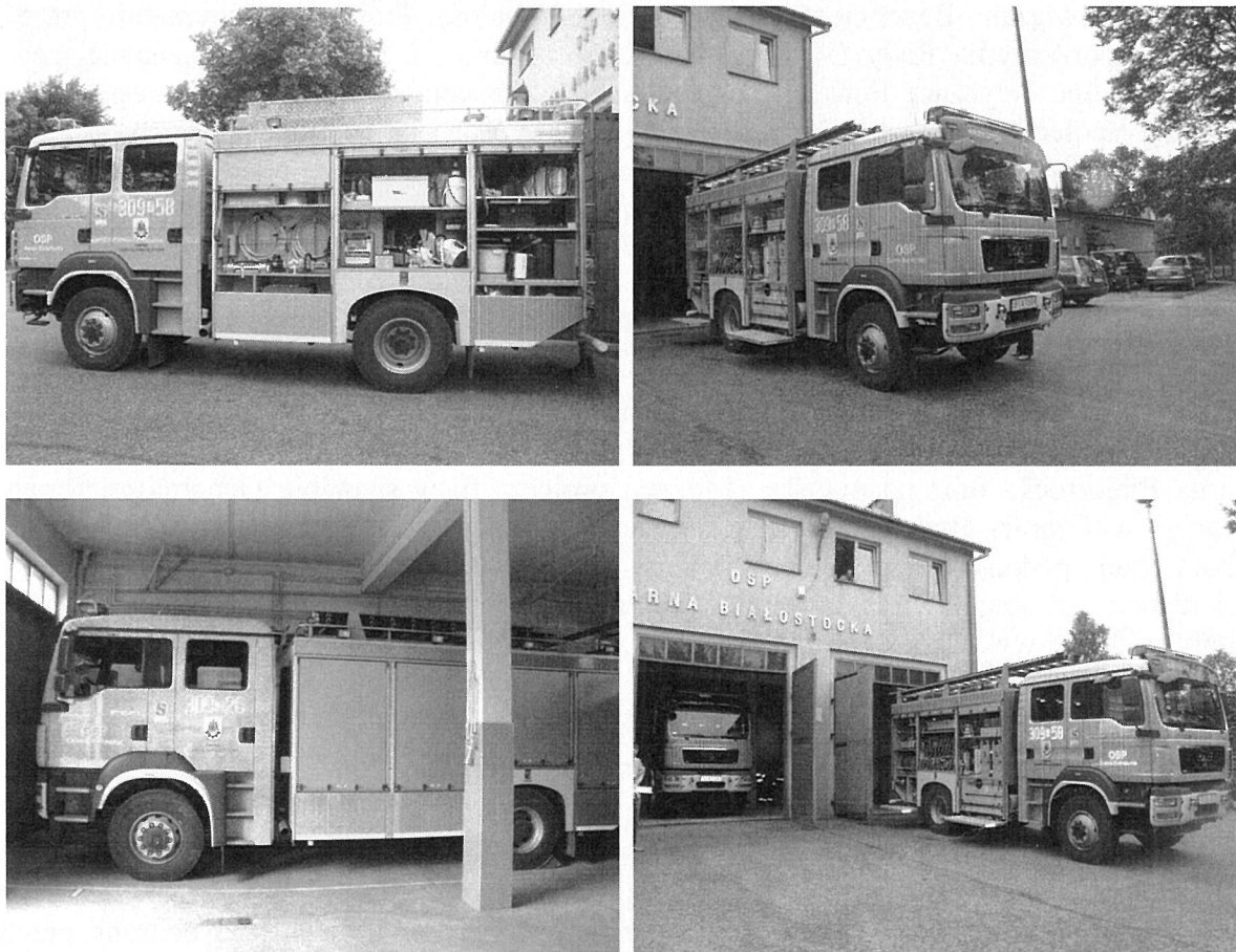
Dwa specjalistyczne wozy strażackie z wyposażeniem

Dokumentacja faktograficzna wykonana przez zespół kontrolujący w dniu 26.06.2013 r. w trakcie wizyty monitorującej w miejscu realizacji projektu